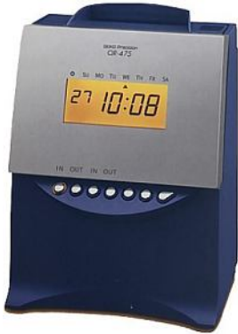
182x242x140mm – 2,2kg