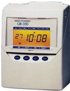
160x205x128mm - 1,5kg