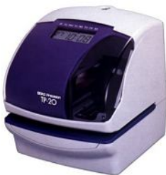
156x181x177mm – 1,8kg