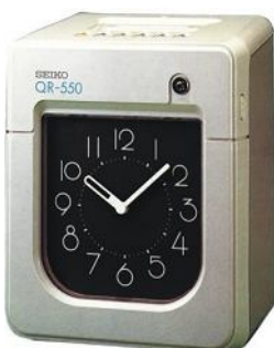
200x257x151mm - 2,5kg