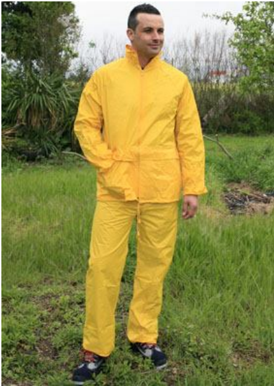
TRAJE DE AGUA IGUAZÚ