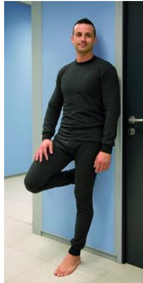
CAMISETA Y PANTALÓN FRIO EXTREMO