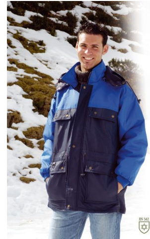
PARKA QUEBEC Ref. 874

Parka impermeable de poliéster Oxford transpirable sobre recubrimiento de poliuretano. Acolchada con tejido de aluminio que proporciona ligereza y protección contra el frío. Forro de nylon, puños elásticos y capucha externa acolchada.