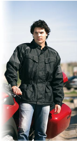
PARKA RIDER Ref. 865

Parka de poliéster Oxford con poliuretano y tiras reflectantes. Interior con forro acolchado de poliéster. Cierre con cremallera oculta, tapeta y botones a presión. Ajustable en cintura con tira de velcro. Puño elástico con cierre de velcro.