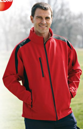
FORRO POLAR ASTON