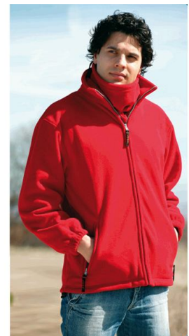
FORRO POLAR HIMALAYA