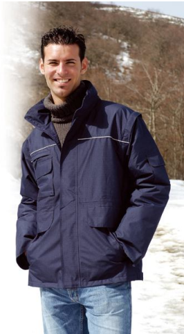
PARKA TIMBER Ref. 878

Parka de poliéster con recubrimiento de PVC y acabado ripstop. Costuras termoselladas y cierre de cremallera y corchetes. Forro polar de 350gr/m2. Mangas acolchadas de poliéster desmontables. Capucha interior con cierre de velcro.