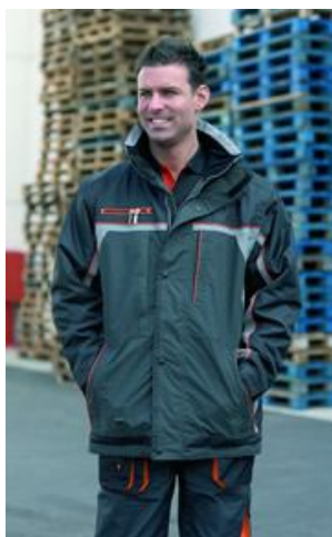
PARKA TRICOLOR RODAS Ref. 965

Parka de poliéster Oxford/PVC en hombros y mangas resto prenda nylon, acolchado 100% poliéster, cierres cremallera y corchetes, puños elásticos con cierres de velcro, capucha y mangas desmontables.