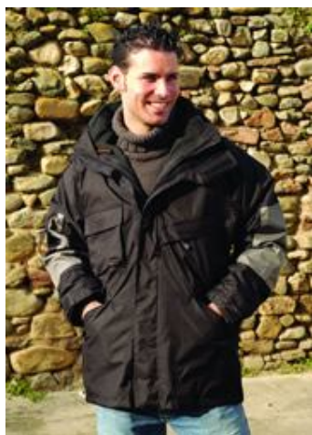
PARKA CUATRO EN UNO DAYTONA Ref. 879

Parka de poliéster con recubrimiento de PVC y acabado ripstop. Forro polar desmontable gris que se convierte de uso individual o chaleco. Costuras termoselladas y cierre de cremallera y velcro, capucha interior con cierre de velcro.