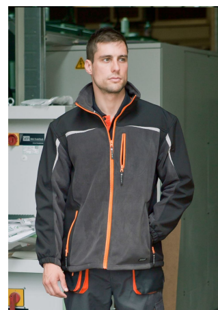
CHAQUETA CORTAVIENTOS / FORRO POLAR Ref. 967

Tejido forro polar 92% poliéster, 8% spandex 280gr/m2. Cierre cremallera y puño elástico, tres bolsillos frontales y dos interiores con cremallera.