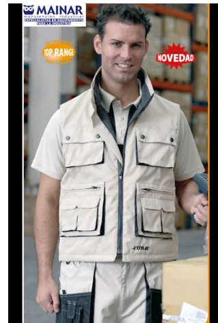
CHALECO PROFESIONAL Ref. 837

Multibolsillos, fabricado en poliéster y poliuretano. Interior en poliéster (1/4) y forro polar (3/4). Goma elástica sobre los lados para un mejor ajuste.