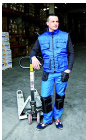
CHALECO PROFESIONAL Ref. 837

Multibolsillos, fabricados en poliéster y poliuretano. Interior en poliéster (1/4) y forro polar (3/4). Goma elástica sobre los lados para un mejor ajuste.