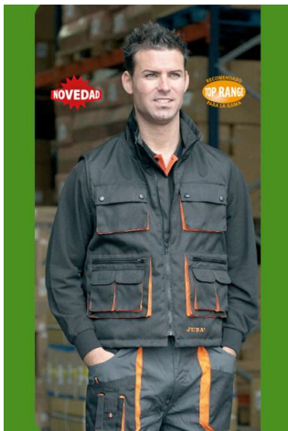
CHALECO PROFESIONAL Ref. 837

Multibolsillos, fabricado en poliéster y poliuretano. Interior en poliéster (1/4) y forro polar (3/4). Goma elástica sobre los lados para un mejor ajuste.