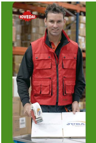
CHALECO PROFESIONAL Ref. 837

Multibolsillos, fabricado en poliéster y poliuretano. Interior en poliéster (1/4) y forro polar (3/4). Goma elástica sobre los lados para un mejor ajuste.