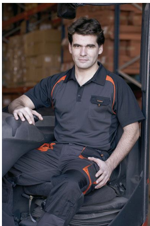
POLO MANGA CORTA