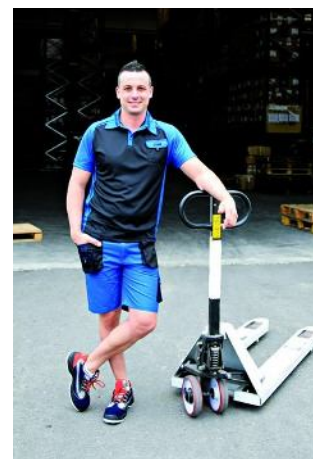
POLO MANGA CORTA