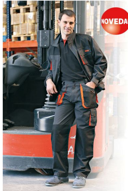
CAZADORA Ref. 960

Multibolsillos, 65% poliéster / 35% algodón y detalles en poliéster. Puños elásticos y elástico en cintura. Cierre de cremallera y velcro.