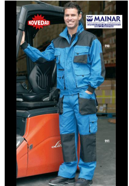
CAZADORA Ref. 990

Multibolsillos, 65% poliéster / 35% algodón y detalles en poliéster. Puños elásticos y elástico en cintura. Cierre de cremallera y velcro.