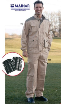
CHAQUETA Ref. 943

Multibolsillos de poliéster (65%) y algodón (35%) en tejido de 240gr/m2. Cierre cremallera con tapeta, cuello con botones a presión. Puño y media cintura elástica. Ventilación en axilas.