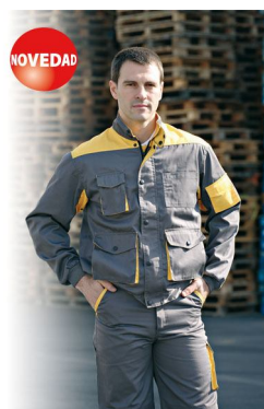
CHAQUETA Ref. 944

Multibolsillos de poliéster (65%) y algodón (35%) en tejido de 240gr/m2. Cierre cremallera con tapeta, cuello con botones a presión. Puño y media cintura elástica. Ventilación en axilas.