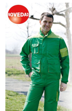
CHAQUETA Ref. 945

Multibolsillos de poliéster (65%) y algodón (35%) en tejido de 240gr/m2. Cierre cremallera con tapeta, cuello con botones a presión. Puño y media cintura elástica. Ventilación en axilas.