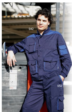
CHAQUETA Ref. 942

Multibolsillos de poliéster (65%) y algodón (35%) en tejido de 240gr/m2. Cierre cremallera con tapeta, cuello con botones a presión. Puño y media cintura elástica. Ventilación en axilas.