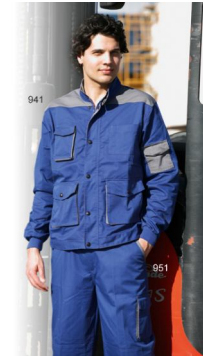
CHAQUETA Ref. 941

Multibolsillos de poliéster (65%) y algodón (35%) en tejido de 240gr/m2. Cierre cremallera con tapeta, cuello con botones a presión. Puño y media cintura elástica. Ventilación en axilas.